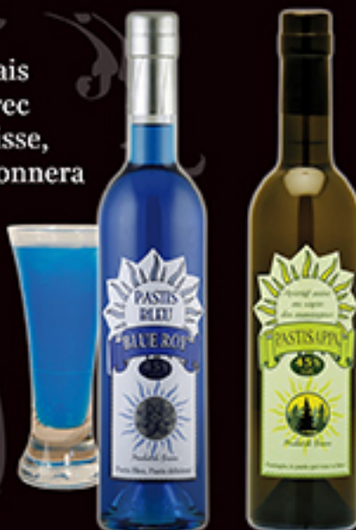
Pastis Blue Roy®

Un pastis au palais typique, anisé avec une note de réglisse, mais qui vous étonnera avec sa belle couleur bleue.