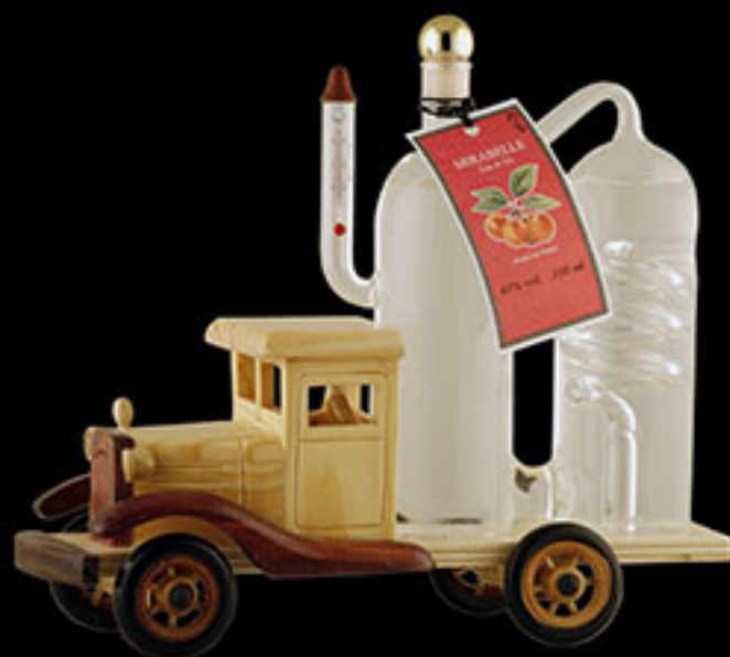
Camion alambic avec eau de vie de Mirabelle