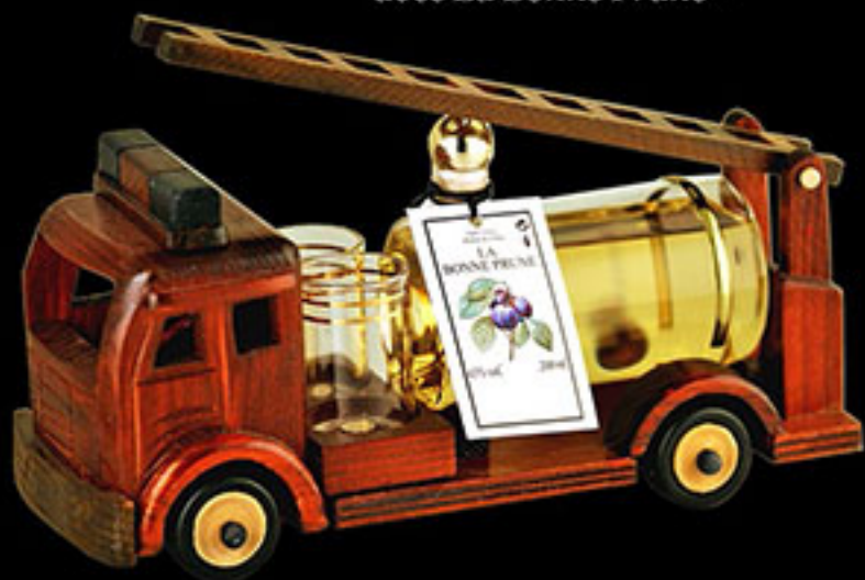
Camion pompier avec La Bonne Prune®