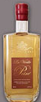
La Vieille Poire®