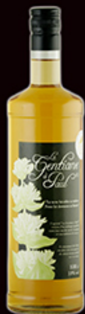
Apéritif à la gentiane

Deux apéritifs au caractère intense, à déguster purs avec des glaçons ou en cocktails