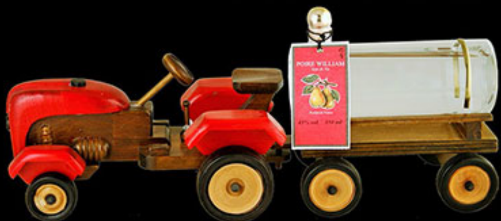
Tracteur avec Eau de Vie de Poire William