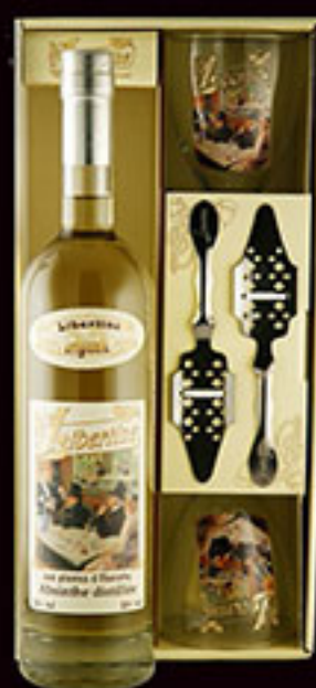
Coffret Libertine® disponible en 55%, 60%, et 72%.