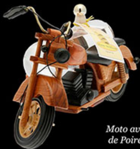
Moto avec Eau de Vie de Poire William