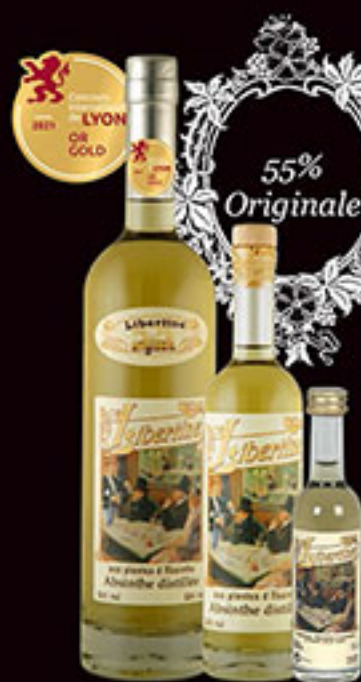
Libertine® 55% en 70cl, 20cl et 5cl