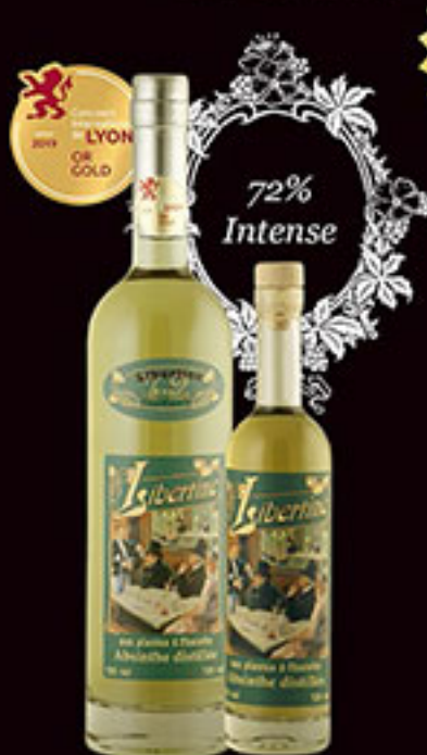
Libertine® 72% en 70cl et 20cl