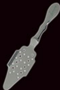
Cuillère à absinthe inox gravée Libertine®