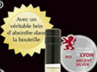
Libertine® Fleur d'Absinthe® 60% vol.