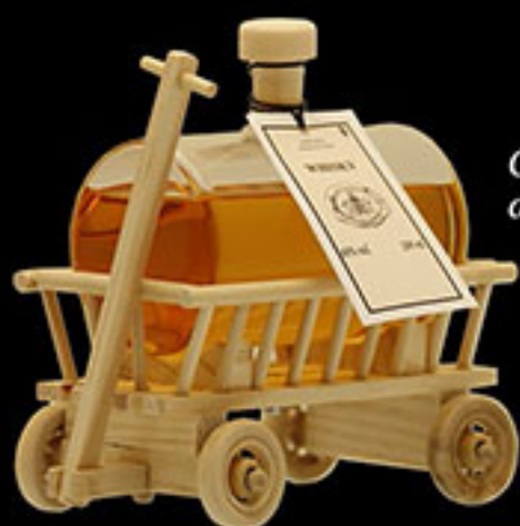
Chariot avec whisky