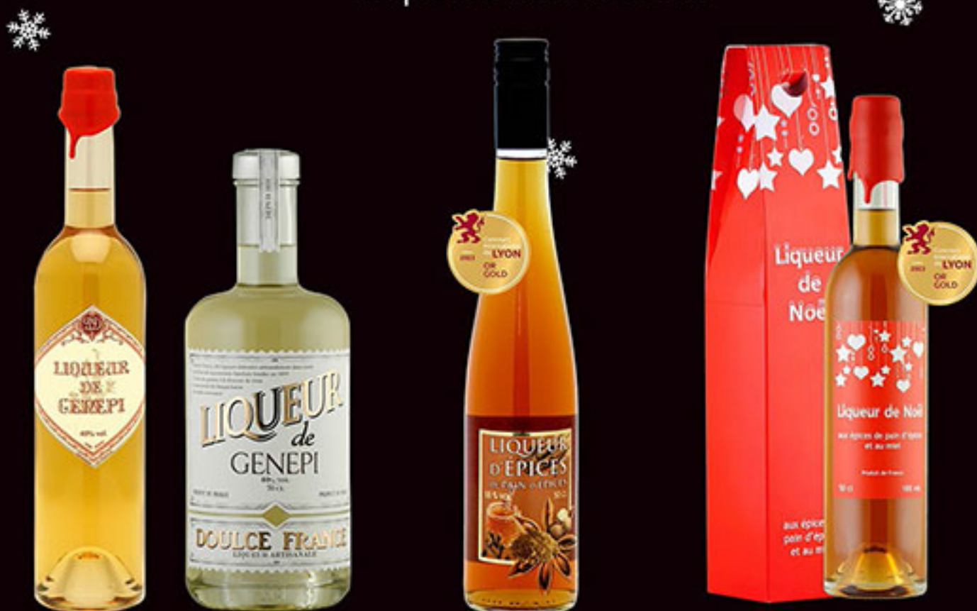
Liqueur de Génépi 50cl et 70cl