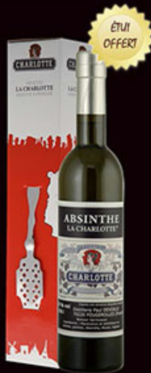
La Charlotte aux plantes d'Absinthe® 55% + étui + cuillère