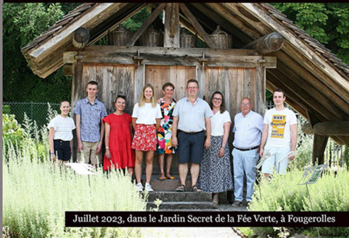
Juillet 2023, dans le Jardin Secret de la Fée Verte, à Fougerolles