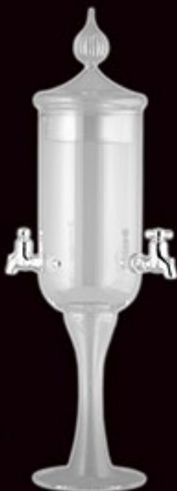
Fontaine 2 robinets