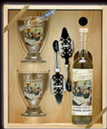
Caisse bois Libertine® 20 cl

Coffret bois, couvercle plexiglas comprenant Une caisse bois + 2 verres Libertine® + 2 cuillères + 1 livret explicatif + 1 absinthe Libertine® 20cl. Disponible en 55% et 72%