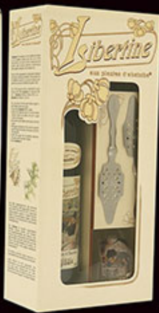
Étui pour gamme Libertine® 70 cl + cuillère + étui