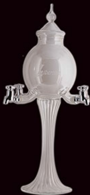
Fontaine Libertine® 4 robinets